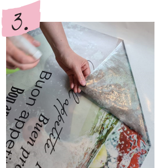
Motiv beim Abziehen mit einer Wasser-Spülmittel-Lösung einsprühen.