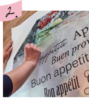
Motiv vorsichtig im flachen Winkel vom Trägerpapier entfernen.