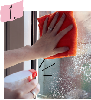
Glasfläche von Staub- und Fettresten befreien.