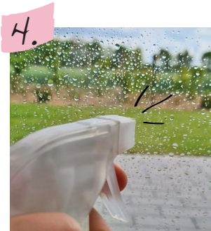
Anschließend die Glasfläche mit der Wasser-Spülmittel-Lösung einsprühen.