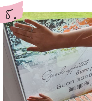
Glasdekor anbringen und an die gewünschte Position schieben.